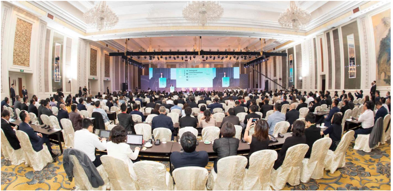
2017 年度十如论坛圆满举行。