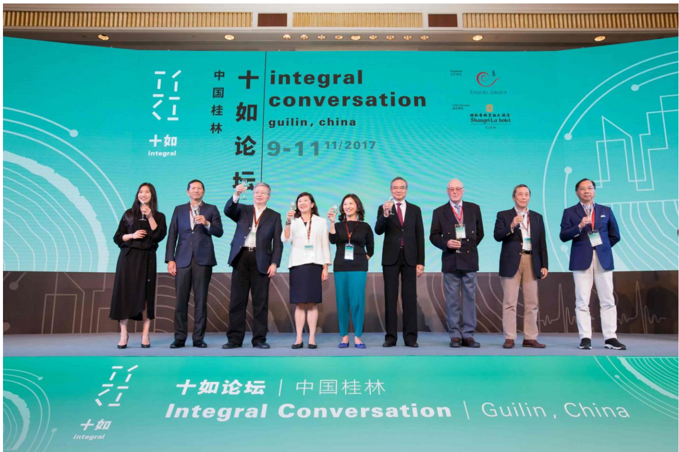
2017 十如论坛正式开幕。