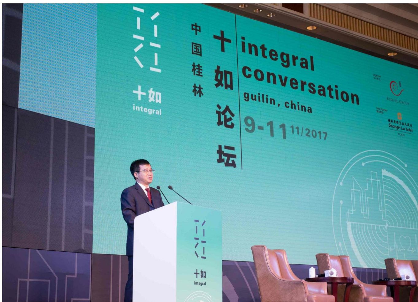
桂林市委副书记樊新鸿致欢迎辞。