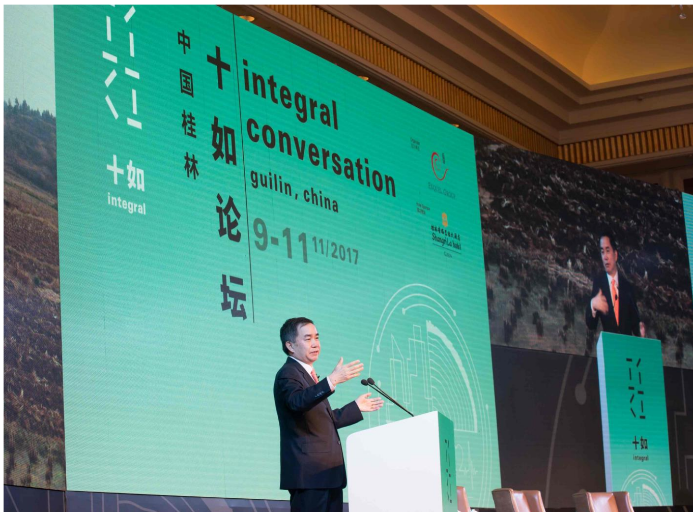
香港大学亚洲环球研究所总监、香港大学经济及金融学院和冯国经冯国纶基金教授(经济学)陈志武于主题演讲中探讨了科技和全球化带来的影响。